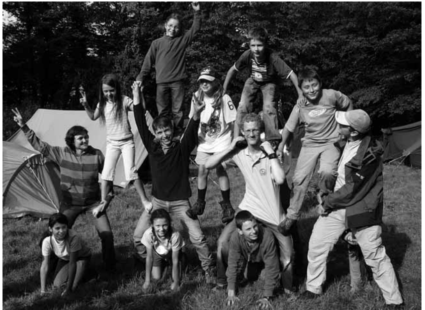
Im Pfingstlager kamen sich die Jugendnaturschutzgruppen aus der Schweiz und dem Elsass spielerisch näher.

An Pfingsten stand in diesem Jahr für die Jugendnaturschutzgruppen Baselland und Laufental etwas Besonderes auf dem Programm: Die beiden Gruppen waren eingeladen, drei Tage zusammen mit französischen Kindern und Jugendlichen von NatuRhena zu verbringen, eine Organisation, die sich für die Förderung grenzüberschreitenden Austauschs innerhalb der Region TriRhena in den Bereichen der Beziehungen zwischen Mensch und Natur einsetzt. Die Einladung folgte auf ein Treffen vor einem Jahr in Itingen, das der Jugendnaturschutz Baselland organisiert hatte.