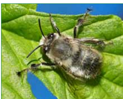
Pelzbiene auf Hopfenblatt