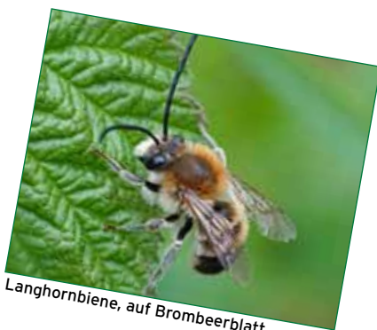
Langhornbiene, auf Brombeerblatt