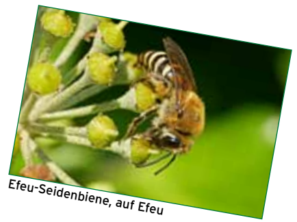
Efeu-Seidenbiene, auf Efeu