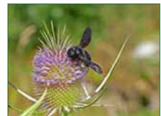
Blaue Holzbiene, auf Wilder Karde