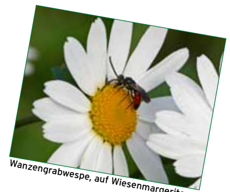
Wanzengrabwespe, auf Wiesenmargerite