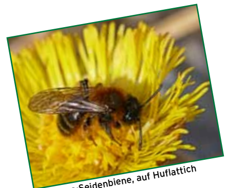
Frühlings-Seidenbiene, auf Huflattich