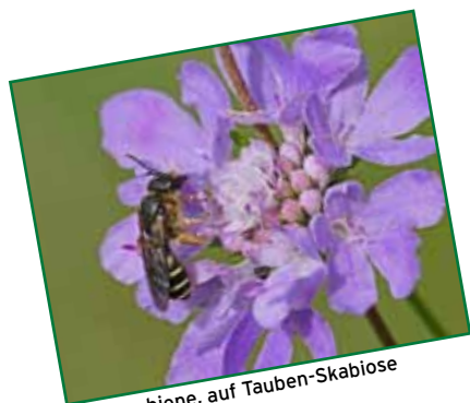
Furchenbiene, auf Tauben-Skabiöse