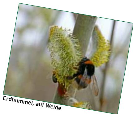
Erdhummel, auf Weide