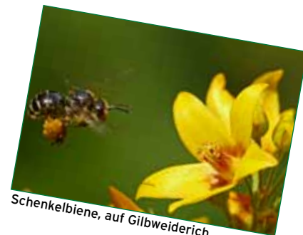
Schenkelbiene, auf Gilbweiderich