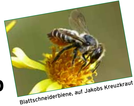
Blattschneiderbiene, auf Jakobs Kreuzkraut