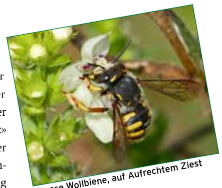
Grosse Wollbiene, auf Aufrechtem Ziest