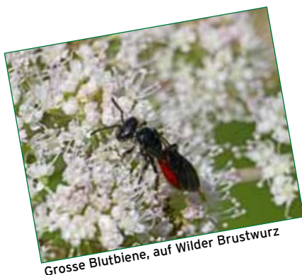
Grosse Blutbiene, auf Wilder Brustwurz