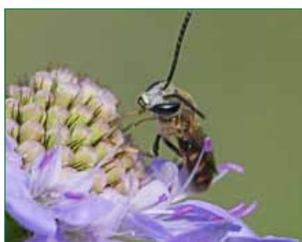
Gewöhnliche Schmalbiene, auf Tauben-Skabiose