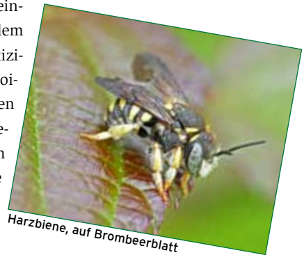
Harzbiene, auf Brombeerblatt