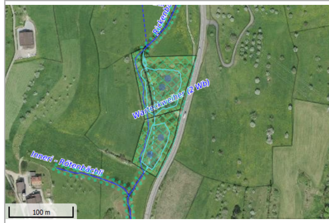
Kantonales Gewässernetz 1996 Kommunale Naturschutzzone (Überlagend / Grundnutzung) Inventar der kantonal geschützten Naturobjekte Plangrundlagen: GIS-Fachstelle BL