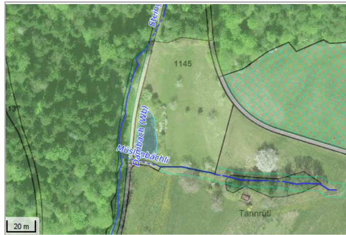
Kantonales Gewässernetz 1996, Kommunale Naturschutzzone (Überlagernd / Grundnutzung), Inventar der kantonal geschützten Naturobjekte Plangrundlagen: GIS-Fachstelle BL