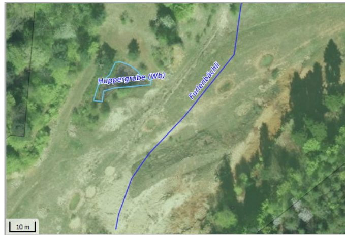
Kantonales Gewässernetz 1996, Kommunale Naturschutzzone (Überlagern / Grundnutzung), Inventar der kantonal geschützten Naturobjekte Plangrundlagen: GIS-Fachstelle BL