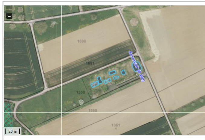
Kantonales Gewässernetz Kommunale Naturschutzzone (Überlagern / Grundnutzung) Inventar der kantonal geschützten Naturobjekte Plangrundlagen: GIS-Fachstelle BL