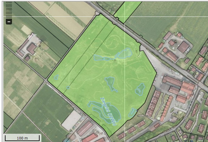
Kantonales Gewässernetz 1996 Kommunale Naturschutzzone (Überlagernd / Grundnutzung) Inventar der kantonal geschützten Naturobjekte Plangrundlagen: GIS-Fachstelle BL