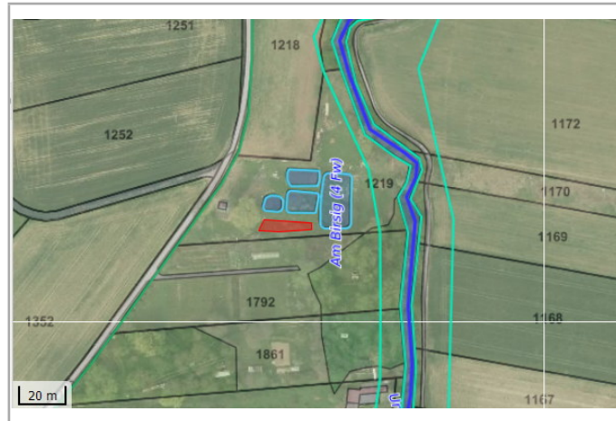
Kantonales Gewässernetz 1996, Kommunale Naturschutzzone (Überlagern / Grundnutzung), Inventar der kantonal geschützten Naturobjekte Plangrundlagen: GIS-Fachstelle BL