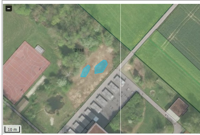
Kantonales Gewässernetz Kommunale Naturschutzzone (Überlagernd / Grundnutzung) Inventar der kantonal geschützten Naturobjekte Plangrundlagen: GIS-Fachstelle BL