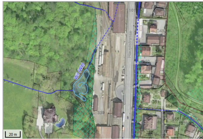
Kantonales Gewässernetz Kommunale Naturschutzzone (Überlagern / Grundnutzung) Inventar der kantonal geschützten Naturobjekte Plangrundlagen: GIS-Fachstelle BL

Gemeinde Bezirk Koordinaten Link zum kant. Geoviewer Grstk Nr Eigentümer