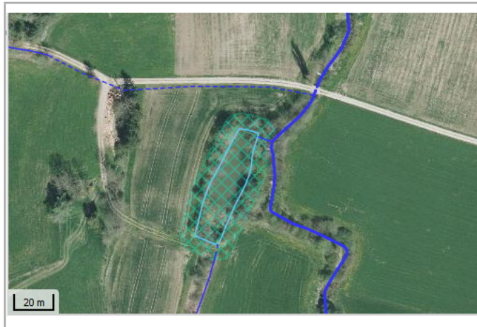
Kantonales Gewässernetz 1996, Kommunale Naturschutzzone (Überlagern / Grundnutzung), Inventar der kantonal geschützten Naturobjekte Plangrundlagen: GIS-Fachstelle BL