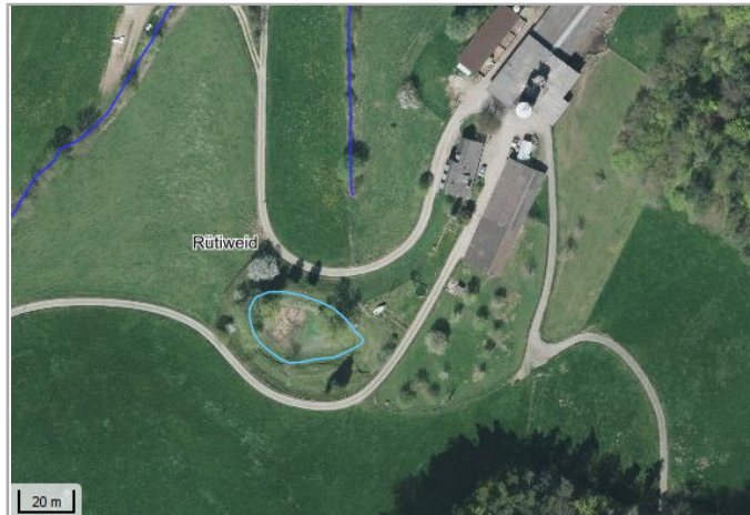
Kantonales Gewässernetz 1996 Kommunale Naturschutzzone (Überlagemd / Grundnutzung) Inventar der kantonal geschützten Naturobjekte Plangrundlagen: GIS-Fachstelle BL